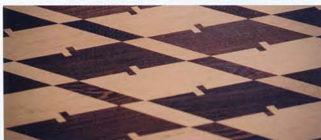
Plaatsing van een 'Pieds de poule parket'

met een fries. Het uitzetten van het tracé bij motieven gebeurt in samenspraak tussen de opdrachtgever en de parketlegger.