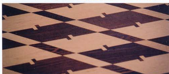
Pose d'un parquet 'Pieds de poule'

ce dernier cas, les lames sont posées parallèlement aux murs. Les panneaux décoratifs se posent généralement en diagonale; ils sont généralement bordés d'une frise le long des murs et des cheminées. Ce sont le maître de l'ouvrage et le parqueteur qui conviennent ensemble du tracé en cas de motif.